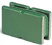
Imán rectangular verde recubierto

Imanes permanentes, potentes y de la más alta calidad; los más utilizados por los matriceros para fijar clavijas en los moldes de yeso.