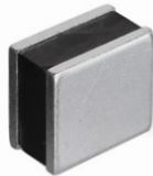
Imán pequeño rectangular galvanizado