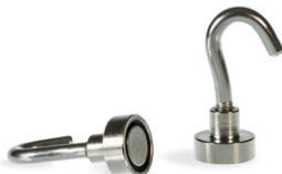
Imán redondo de neodimio con gancho