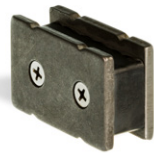
Imán rectangular con dos tornillos