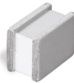
Imán rectangular blanco recubierto