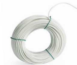
Tubo de fibra de vidrio estándar Ø 5, 6 or 8 mm