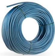
Tubo de fibra de vidrio azul Ø 5 or 6 mm